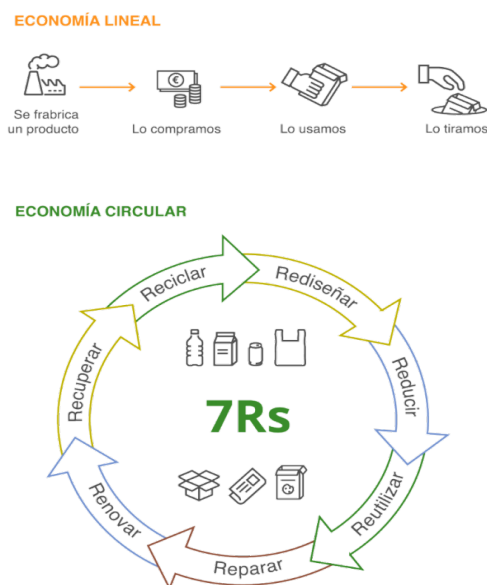
Figura 3: Modelo de economía lineal y economía circular 14 .

El objetivo del modelo de economía circular es aprovechar al máximo los recursos disponibles al mismo tiempo que se preserva y disminuyen los impactos al medio ambiente. Este modelo también aboga por la optimización de los materiales y residuos, alargando su vida útil. Para lograr lo anterior, la economía circular hace uso de las 7Rs. Las 7Rs implican que, los productos, sean diseñados para ser reutilizados. En contraposición al modelo de producción actual la economía circular junto con las 7Rs y el ecodiseño considera la variable ambiental como un criterio más a la hora de tomar decisiones en el proceso de diseño de los productos 13 .