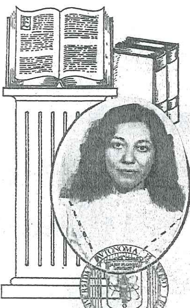
FIRMA DE LA ESTUDIANTE