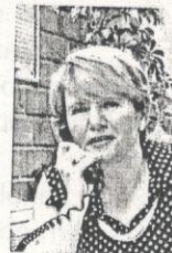
Autora: Loretta Ortiz Ahlf*

El siguiente artículo, al analizar la figura novedosa de los Acuerdos Ejecutivos, así como la de los Acuerdos Interinstitucionales, reflexiona sobre la constitucionalidad del Proyecto de la LGCAT, pues al tener esas figuras la misma jerarquía que los tratados y no necesitar de la aprobación del Senado de la República podrían generar abusos.