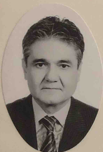
CENTRO JURÍDICO UNIVERSITARIO

Con Reconocimiento de Validez Oficial de Estudios de la Secretaría de Educación Pública, según Acuerdo No. 20122422, de fecha 30 de Octubre de 2012, en atención a que terminó los estudios correspondientes el día 09 de Junio de 2016 .