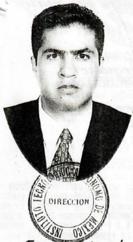
Firma del Interesado