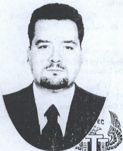
Universidad Tecnológica de México