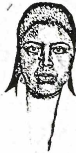
Firma del Interesado