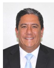
Sen. Marco Antonio Gama Basarte Integrante