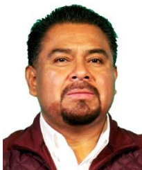
Senador Primo Dothé Mata Integrante