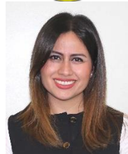
Sen. Indira de Jesús Rosales San Román