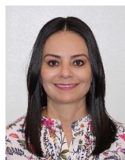
Sen. Nuvia Magdalena Mayorga Delgado Integrante