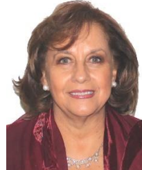
Senadora Martha Lucía Micher Camarena Integrante