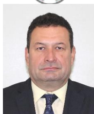
Senador Juan Manuel Fócil Pérez Integrante