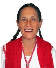
Sen. Jesusa Rodríguez Ramírez