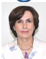
Senadora Patricia Mercado Integrante