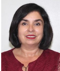
Senadora Antares Guadalupe Vázquez Alatorre Integrante