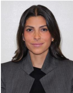
Sen. Sylvana Beltrones Sánchez