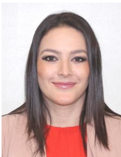
Sen. Martha Cecilia Márquez Alvarado