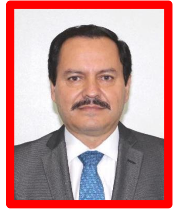
Senador Ángel García Yáñez "Partido Revolucionario Institucional"