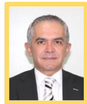
Senador Miguel Ángel Mancera Espinosa "Partido de la Revolución Democrática"