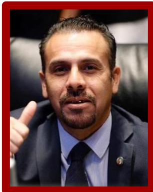
Senador Ricardo Velázquez Meza "Movimiento Regeneración Nacional"