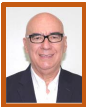
Senador Dante Alfonso Delgado Rannauro "Movimiento Ciudadano"