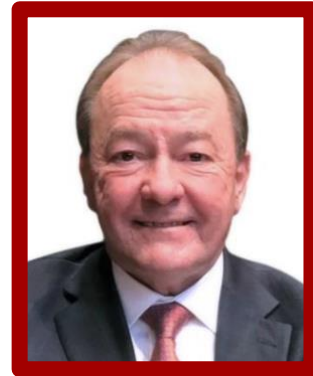
Senador Arturo Bours Griffith "Movimiento Regeneración Nacional"