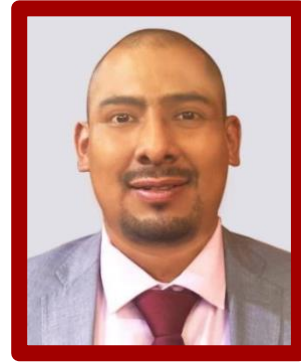
Senador Eli César Eduardo Cervantes Rojas "Movimiento Regeneración Nacional"