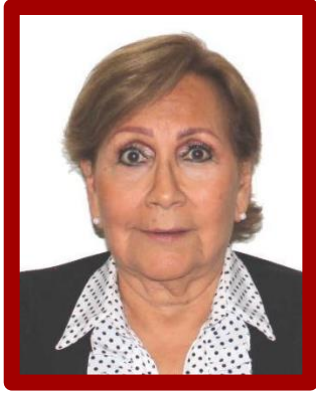
Senadora Ma. Guadalupe Covarrubias Cervantes "Movimiento Regeneración Nacional"